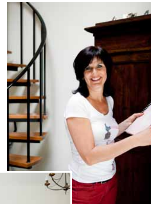
'Na elk gebed kreeg ik rust en energie.'